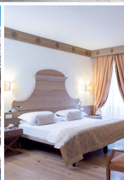
Grand Hotel Savoia & SPA (5*), Cortina d'Ampezzo