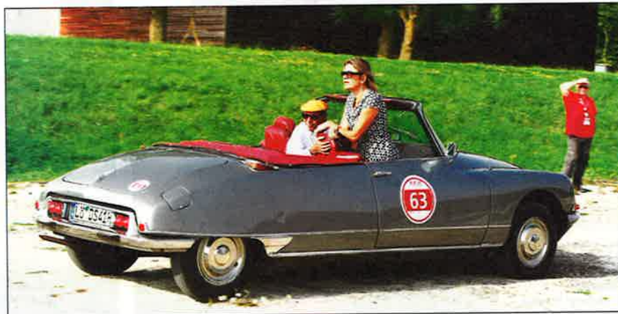
▲ C'est un carrossier de Ludwigshafen qui a transformé cette DS 21 en imitant parfaitement le cabriolet Chapron.