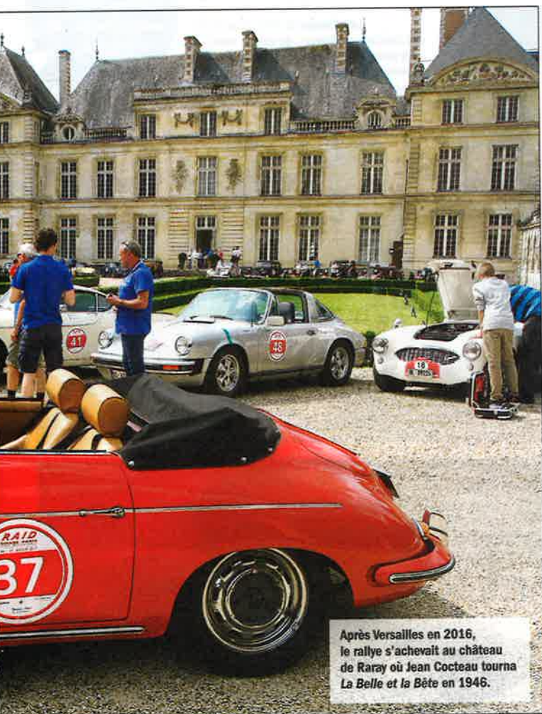
Après Versailles en 2016, le rallye s'achevait au château de Raray où Jean Cocteau tourna La Belle et la Bête en 1946.