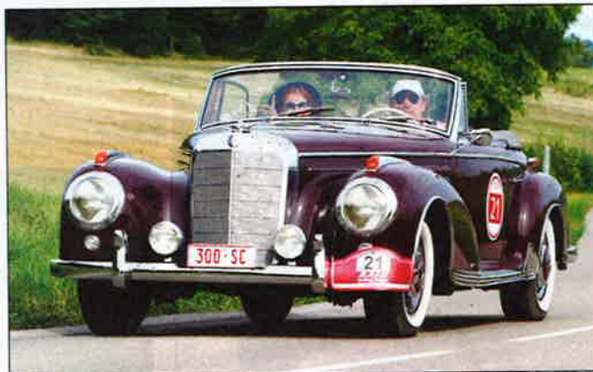
◀ À chacune de ses participations au Raid, Jozef Dockx change de voiture. Cette fois, il utilisait une Mercedes 300 SC (53 exemplaires produits) avec le 6-cylindres en ligne de la 300 SL assemblée à la main en 1956. Elle coûtait 30 % plus chère que le modèle avec les portes papillon.